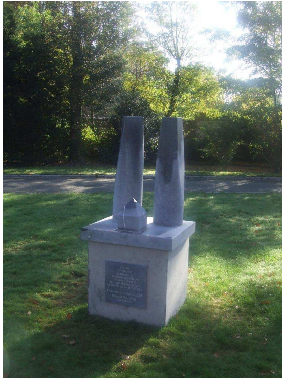
« La Famille » à Tertre de Bernard Descamps