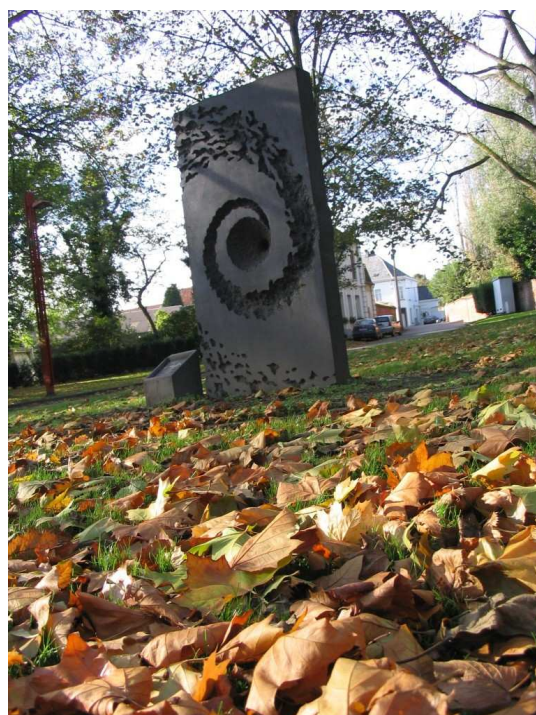
« La Voie lactée » à Baudour de Jacques Iezzi