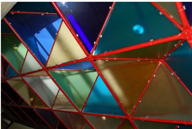
« Le Bonheur de chacun à Hautrage d'Yvette Piret