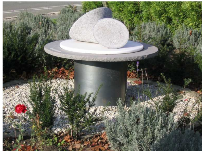
« Dialogues » à Neufmaison de Fortunati Liradelfo