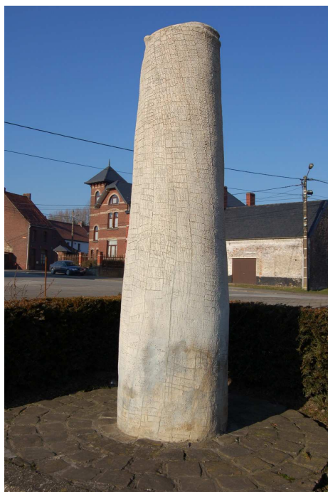
« La Colonne de l'Espoir » à Villerot de René Perrot