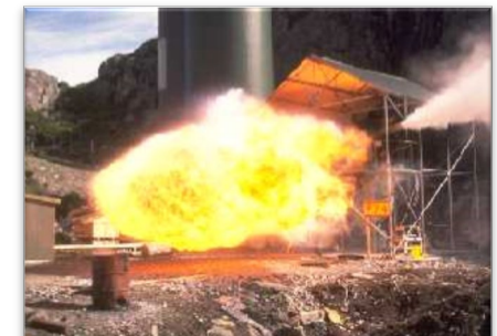
Sécurité (SEVESO, risques, etc.)