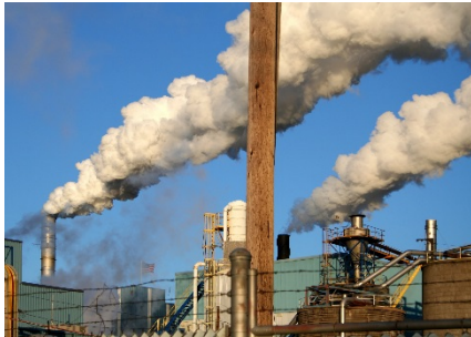
Environnement (EIE, ISO, etc.)