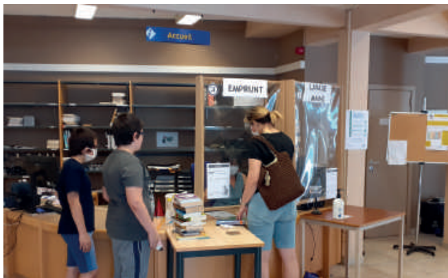
Des mesures de précaution maximum à la Rollandine...

En un temps record, tout a été mis en œuvre pour permettre à un maximum d'agents de traiter leurs dossiers à domicile. L'ensemble du personnel communal a fait face à cette situation inédite avec calme et profession-