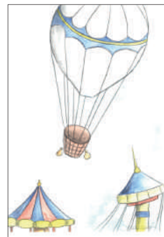
Dessin de Stéphanie Catégorie + de 18 ans