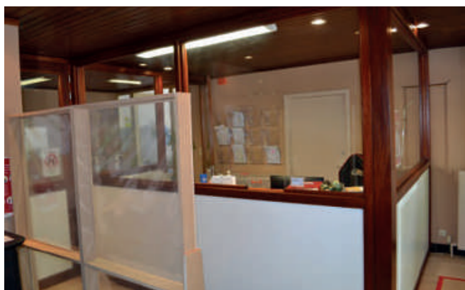
Le sas d'entrée aménagé au CPAS pour accueillir le public en toute sécurité

Afin de gérer les demandes d'aides de ses usagers tout en préservant la santé des intervenants, le CPAS a travaillé à bureaux fermés dès le départ. Toutes les demandes d'aide ont ainsi pu être rencontrées par téléphone et par email grâce, notamment, à un assouplissement des conditions de traitement. De nombreux citoyens ont en effet pâti très rapidement des conséquences du Covid-19. L'accueil imprévu d'un membre de la famille alors que le salaire fait défaut n'en est qu'un exemple.