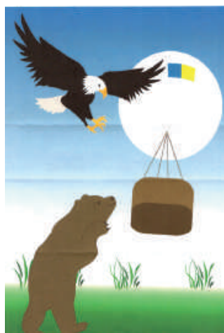
Dessin de Megane Catégorie 12 à 18 ans