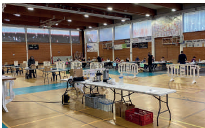
Le hall omnisports de Saint-Ghislain, véritable quartier général pour la distribution des masques et des filtres