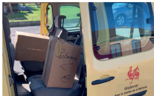
Le Taxi social a assuré la livraison de 16 850 masques auprès des 16 établissements de soins identifiés dans l'Entité.